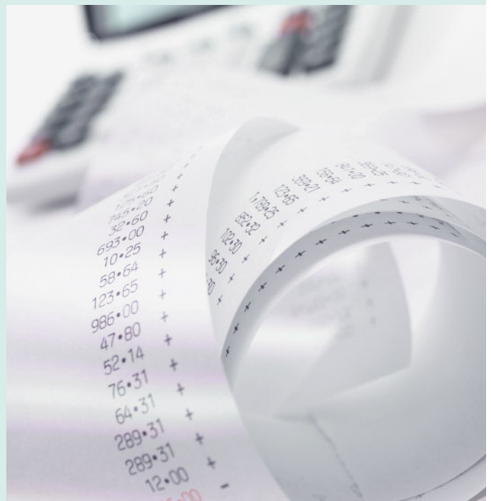
Beispielkalkulationen können zwar helfen, ersetzen aber niemals die individuelle, objektbezogene Kalkulation.